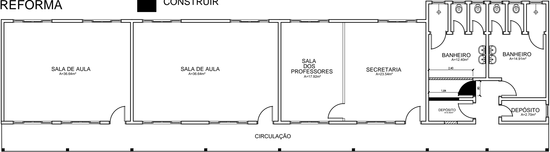
PLANTA BAIXA ESC.:1/125