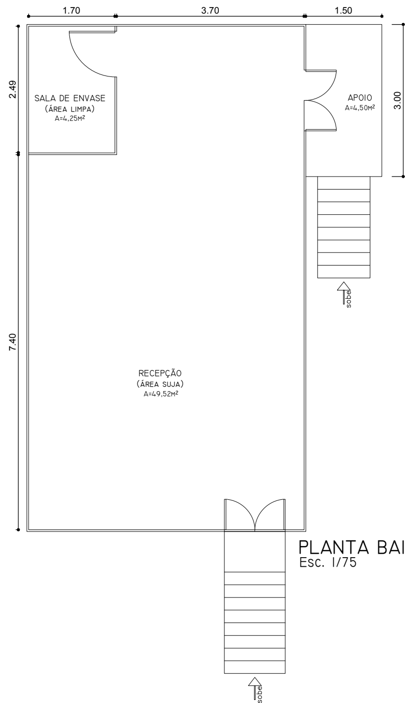
PLANTA BAIXA Esc. 1/75